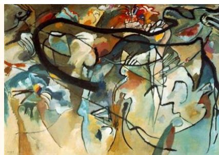
Composição V - 1911