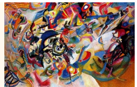
Composição VII- 1913