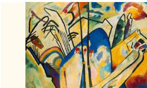
Composição IV - 1911